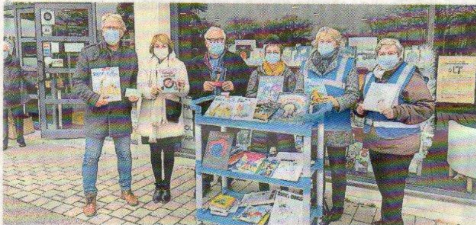
Les bénévoles de la Pépinière d'initiative citoyenne et la librairie Sillage ont organisé une collecte au profit des enfants du Secours populaire.

Le Père Noël vert du Secours populaire va pouvoir distribuer 150 livres à des enfants, de 15 ans et moins, grâce à la générosité des lecteurs et lectrices de la librairie Sillage, mercredi.