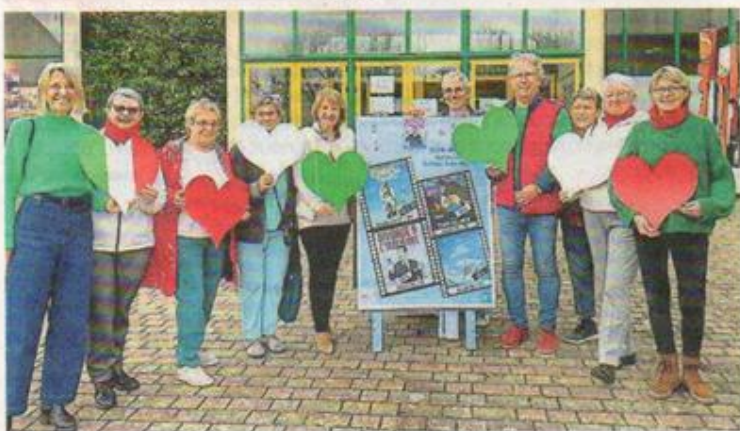
Les membres du Cinéma associatif devant Océanis, samedi dernier.