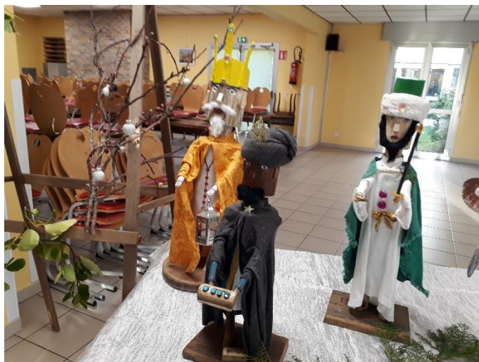
Ils ont fabriqué leur sapin de Noël alternatif