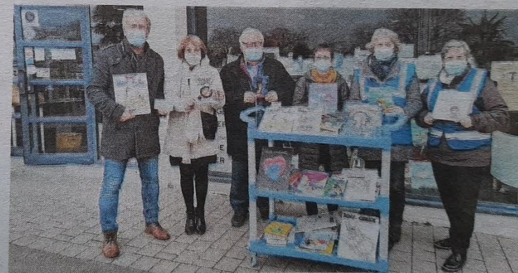
Ces livres seront déposés, par les familles bénéficiaires du Secours populaire, au pied du sapin.

les du ciné-club CAP (Cinéma associatif de Plœmeur), né au sein de Pic, ont été également remises.